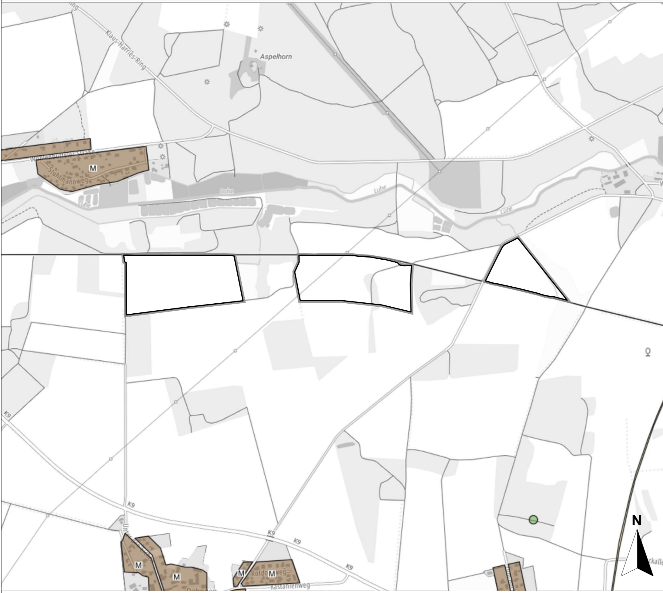
Flächennutzungsplan der Samtgemeinde Amelinghausen, Rechtskräftig seit 1977, Plangrundlage 2023 Geobasisdaten LGLN, Maßstab 1:15.000